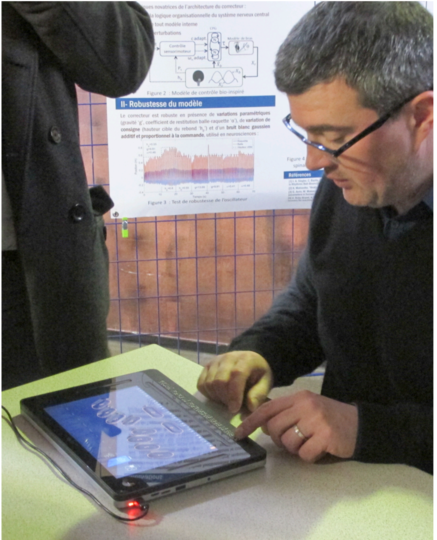
Une tablette braille pour les non voyants