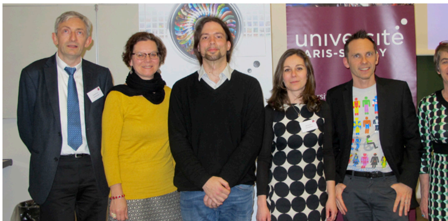
Groupe de travail diversité et handicap - Handiversité 2016 - Université Paris-Saclay